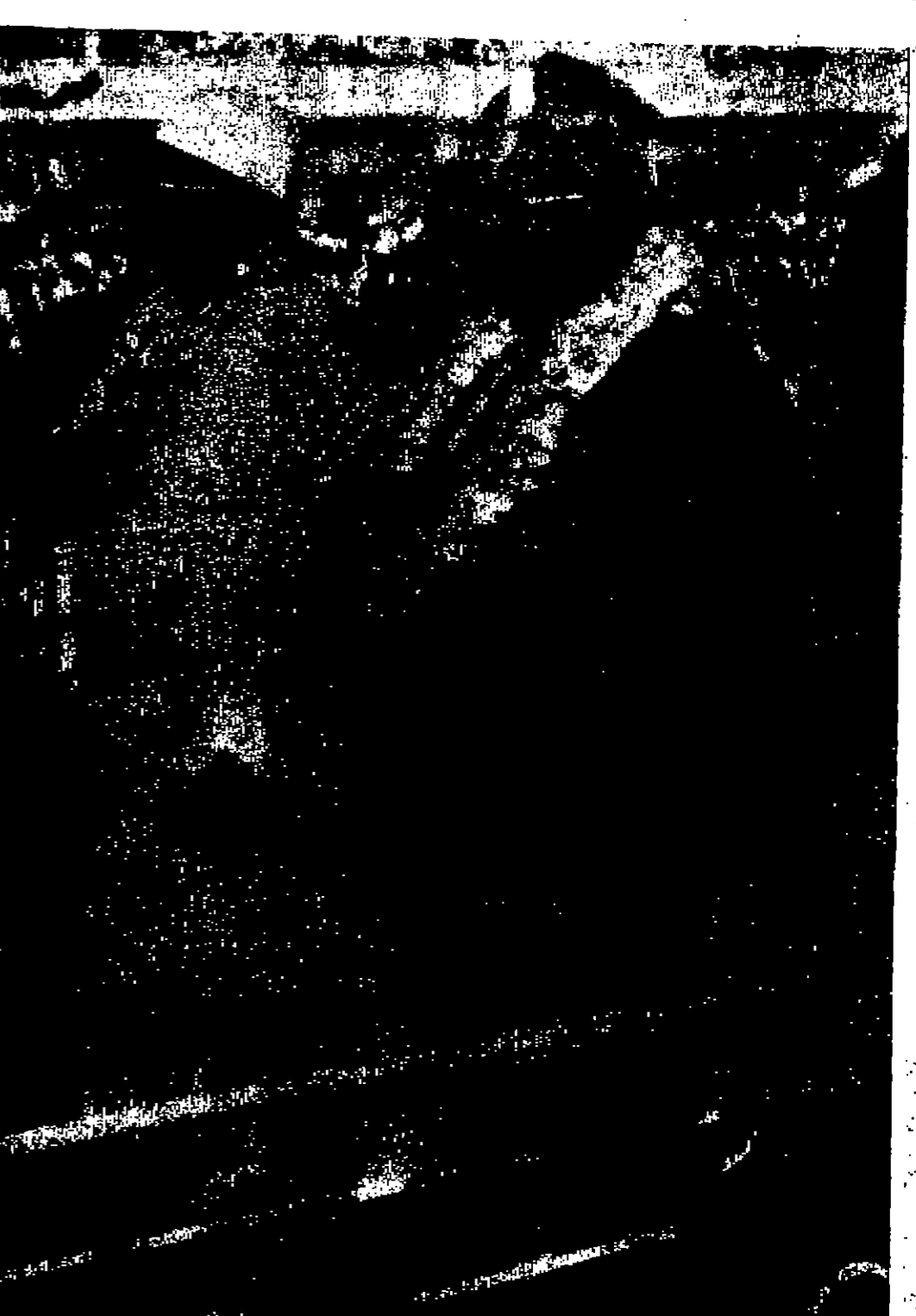
الوزير اساميل الازهي ورئيس مجلس السيادة السوداني وملكيتوري رئيس جمهورية الجيب لسي وصوله الى مطار الخرطوم في زيارة ودية للسودان «مسورة للينديتورس»

تعلم وزارة الدفاع والطيران - سلاح الطيران عن رغبتها في التعاقد مع الخبرات التالية : ١- مهندس معماري ٢- محاسب قانوني ٣- مهندس انشائي ٤- مستشار قانوني ٥- مدرس لغة انكليزية / شهادتجيبية في التخصص مع خبرة في الترجمة ٦- مترجم / شهادة جامعية في التخصص مع خبرة ويفضل من يجيد الطبع على اللغة الكتيبة ٧- خياط قمي ونقل شهادة في التخصص مع خبرة ٨- كاتب آلة عربي / انكليزي واجادة الطبع على الآلة ويفضل من لديه شهادة لغوية مع خبرة ٩- عسكري سيارات ديوم او خبرة في نفس طبيعة العمل ١٠- قلمي لحم سيارات ١١- خياط عسكري من يملك في نفسه الكفاءة ويرغب في العمل ان يقدم الى مكتب المحامي العسكري السعودي بعمان جيبسلمان / الدوار الثاني مصطفىوهلته العلوية والمعلقة للقبلة يوم الثلاثاء الموافق ٢ / تموز ٦٨ م